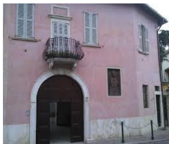
Casa Papa Paolo VI Concesio