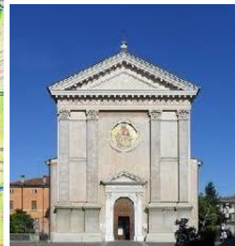
Chiesa Cristo re Brescia