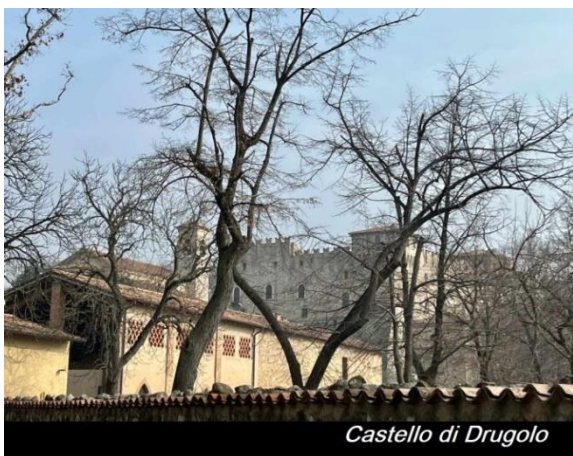
Castello di Drugolo