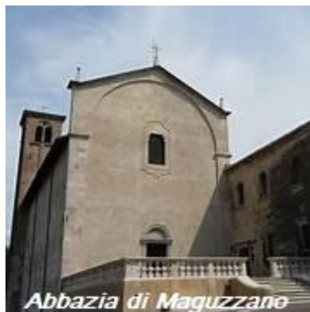
Abbazia di Maguzzano