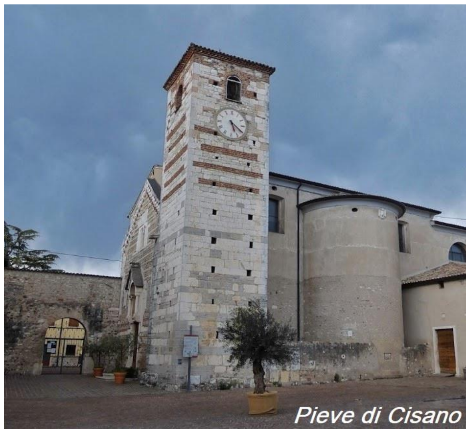
Pieve di Cisano