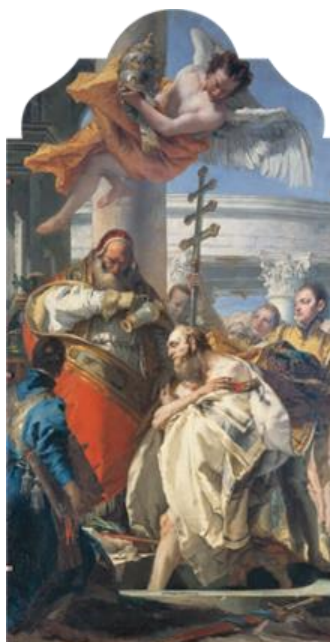
Giovanni Battista Tiepolo , Papa Silvestro nell'atto di battezzare l'Imperatore Costantino