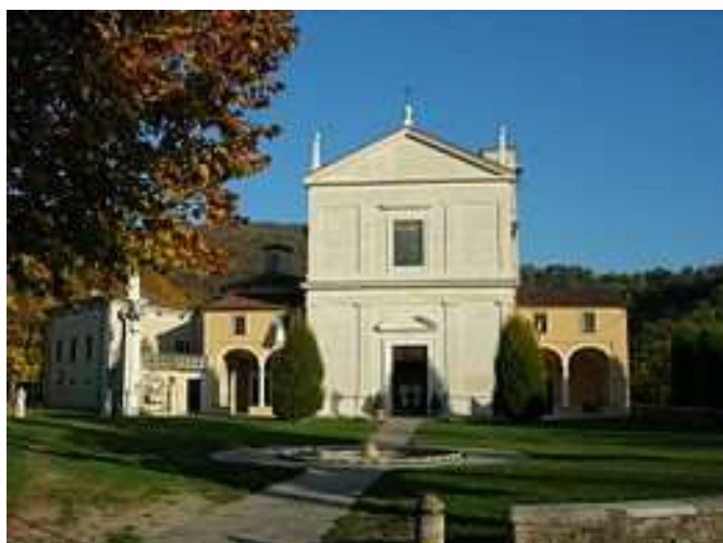
Quadro del Santuario

Il santuario della Madonna di Valverde di Rezzato nasce vicino al luogo dell'apparizione mariana del 1399, l'unica della storia che vede l'apparizione contemporanea del Cristo e della Madonna. Durante la primavera avanzata dell'anno 1399, un contadino sta arando il suo campo; ad un tratto si imbatte in un uomo vestito di rosso che gli ordina di gettare i tre pani che ha nella bisaccia in un laghetto poco distante da lì. Arrivato al laghetto l'uomo viene fermato dalla Madonna, in piedi sulla riva del lago, che lo incarica di tornare dal Signore affinché questo ritiri l'ordine di gettare i tre pani nel laghetto. Dopo essere stato dal Signore, l'uomo torna deciso a gettare i pani nell'acqua ma la Madonna gli spiega che i tre pani significano tre castighi: guerra, fame e peste. La Madonna lo rimanda dal Redentore, e al suo ritorno l'uomo getta nel laghetto un solo pane simbolo della peste. Grazie al Signore fame e guerra erano state evitate.